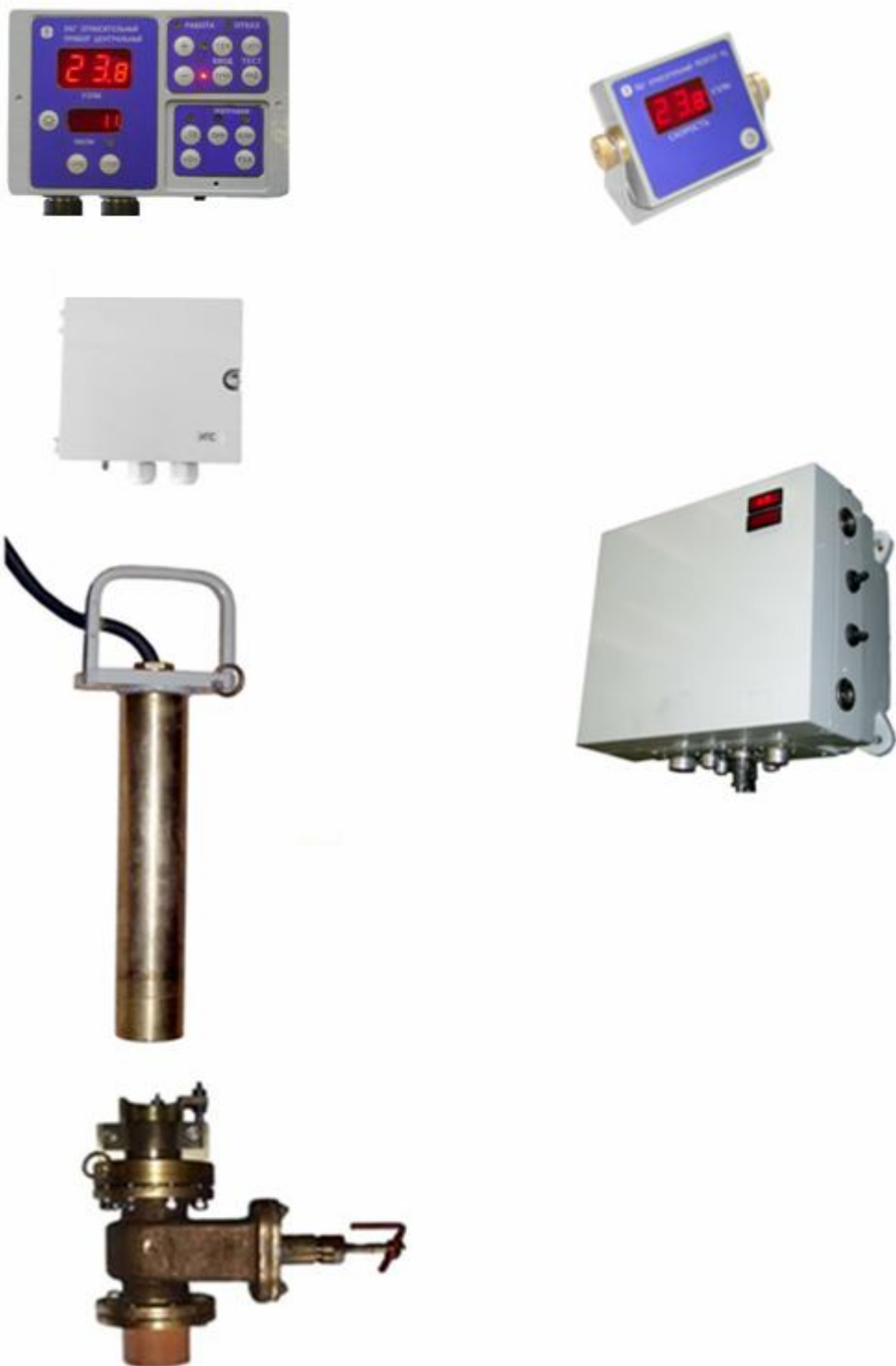
Рисунок 4 Лаг ИЭЛ-3