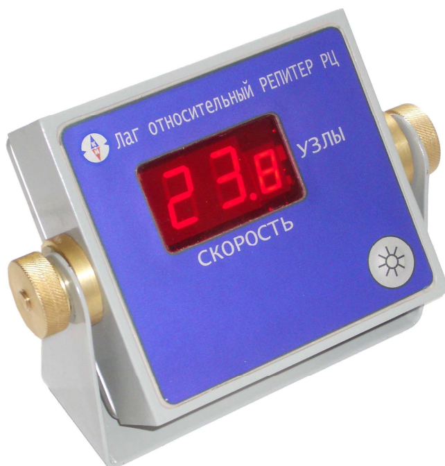
Рисунок 5 РЦ