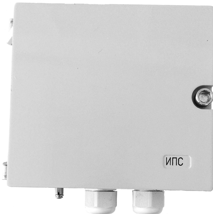
Рисунок 2 ИПС