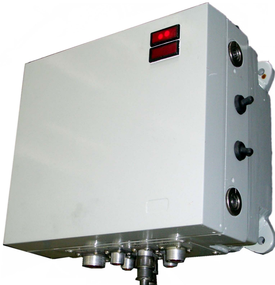
Рисунок 3 БПС