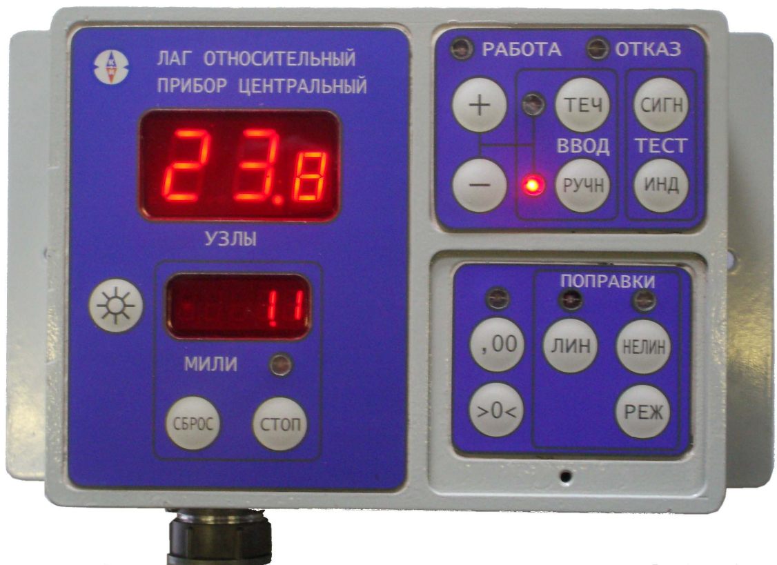
Рисунок 1 Прибор центральный